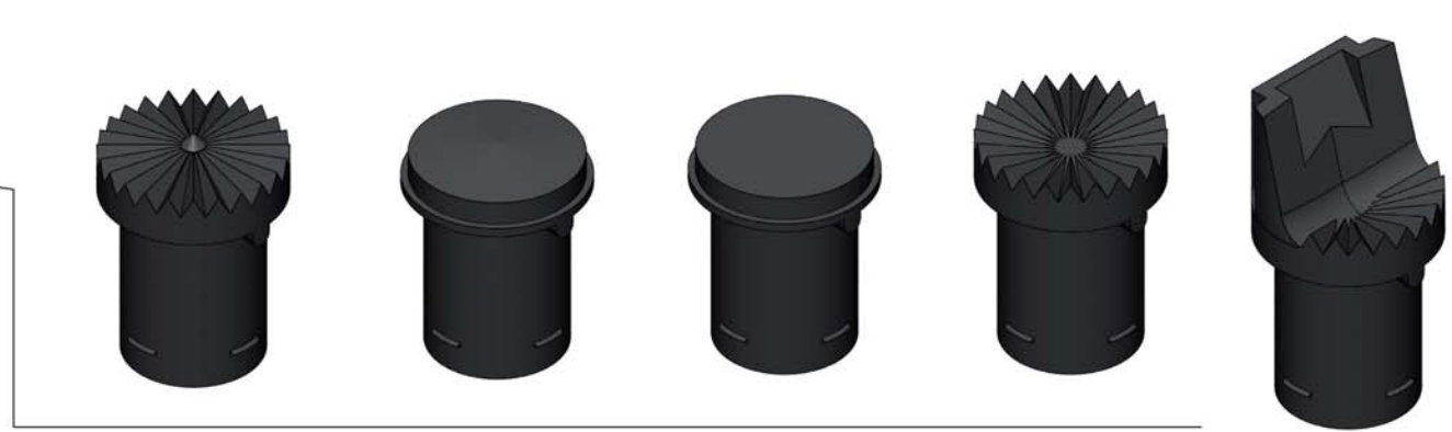
MODELOS DE PLATOS A ELEGIR SEGUN NECESIDADES